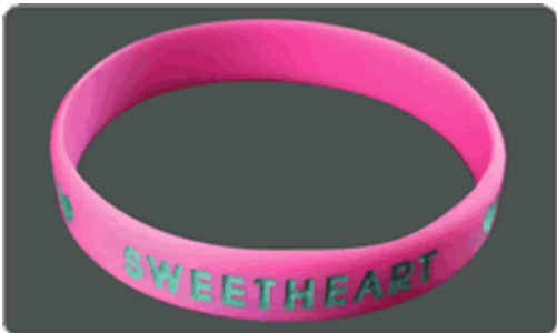
Bajo Relieve Impreso